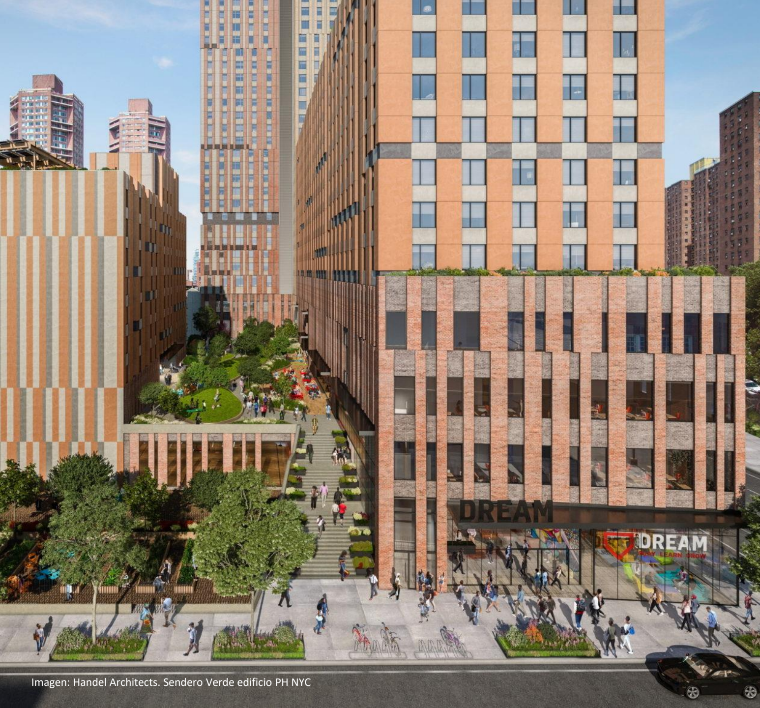
Imagen: Handel Architects. Sendero Verde edificio PH NYC